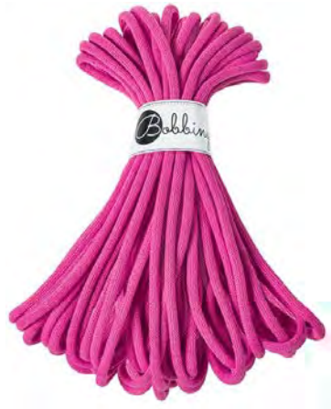
Jumbo 20 m